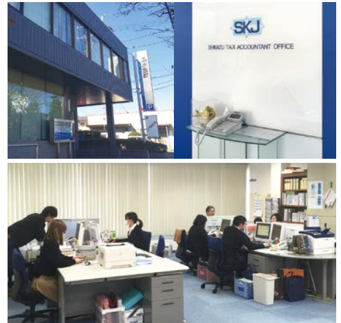
SKJ様を訪問し、お話を聞きました