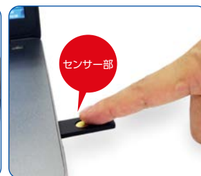
●Yubi Plusを用いたPCログインの手順